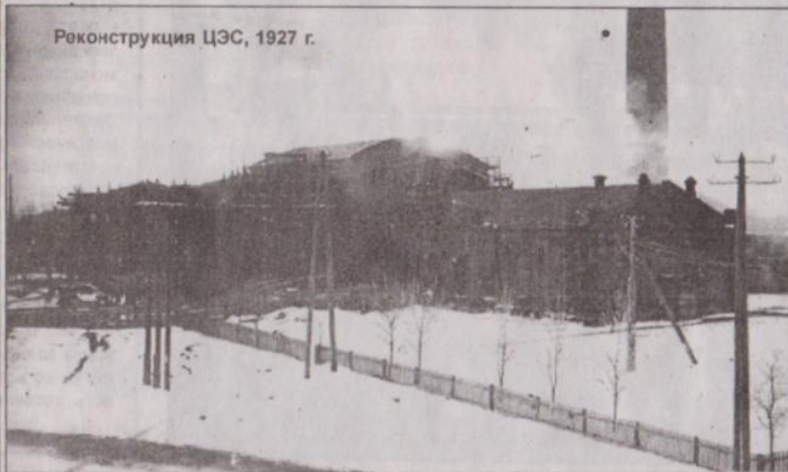
Реконструкция ЦЭС, 1927 г.