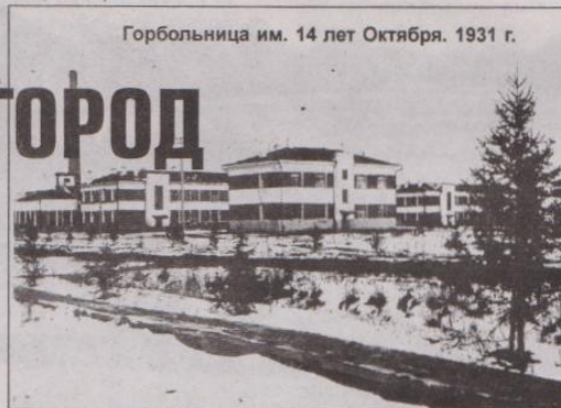
Горбольница им. 14 лет Октября. 1931 г.