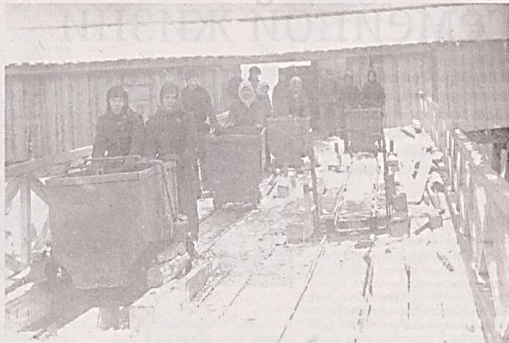
■ Анжерские копи. Откатка вагонеток с углем (1920-е годы).

В 1921 году шахты Анжеро-Судженского рудника выдали на-гора 899,4 тысячи тонн угля. В 1921-1922 годах добыча черного золота на здешних копиях составляла 52,3% от общекузбасской.